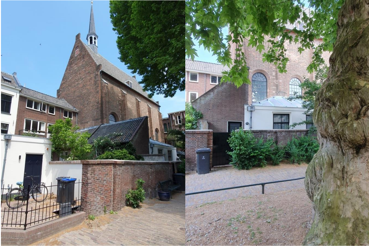
Consistorie gelegen aan de Abraham Dolehof

Nogmaals; komt u zich vergewissen van de schoonheid en de geschiedenis: Welkom!