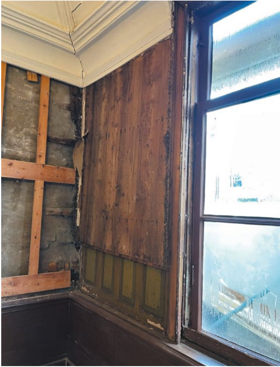
Oude (rond 1850) groene schuifluiken zichtbaar