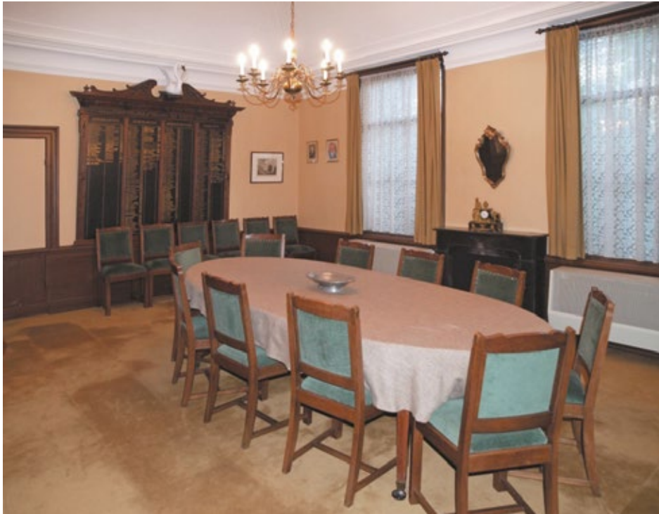
Consistorie vóór restauratie