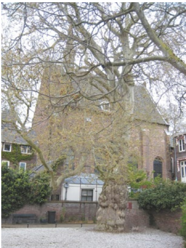
Achteraanzicht kapel, het witte deel is de consistorie