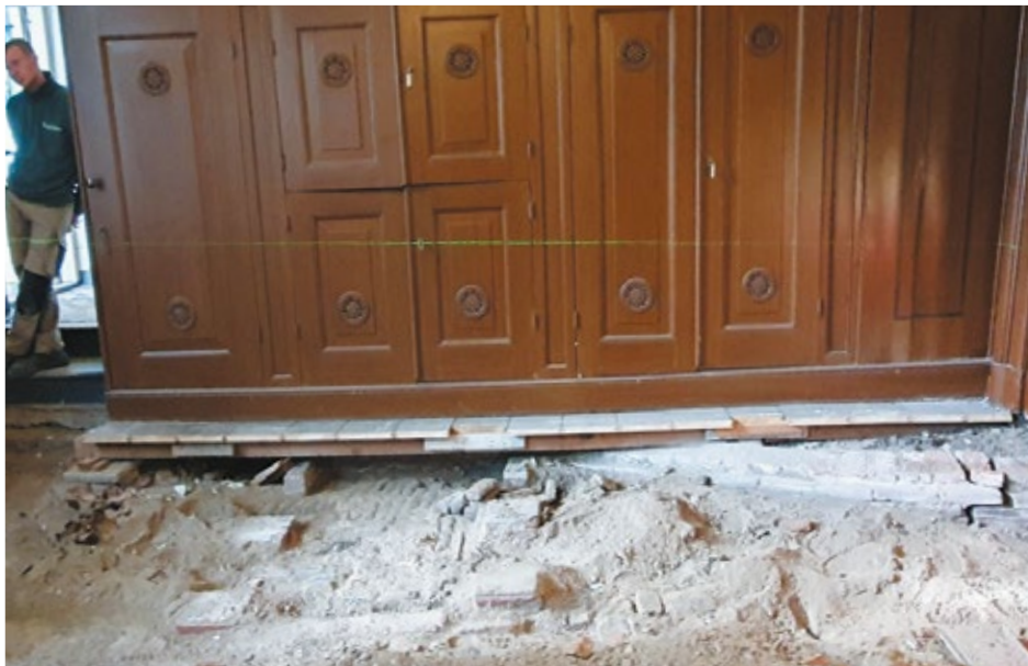
Waterpaslijn (verzakking: 19 cm) en oude steenresten