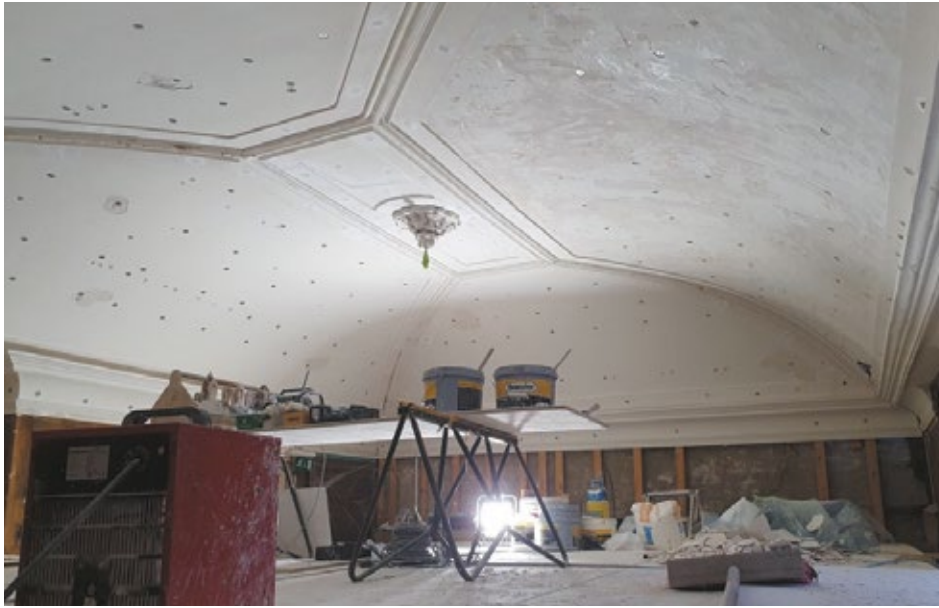
Herstellen van het gewelfde stucplafond