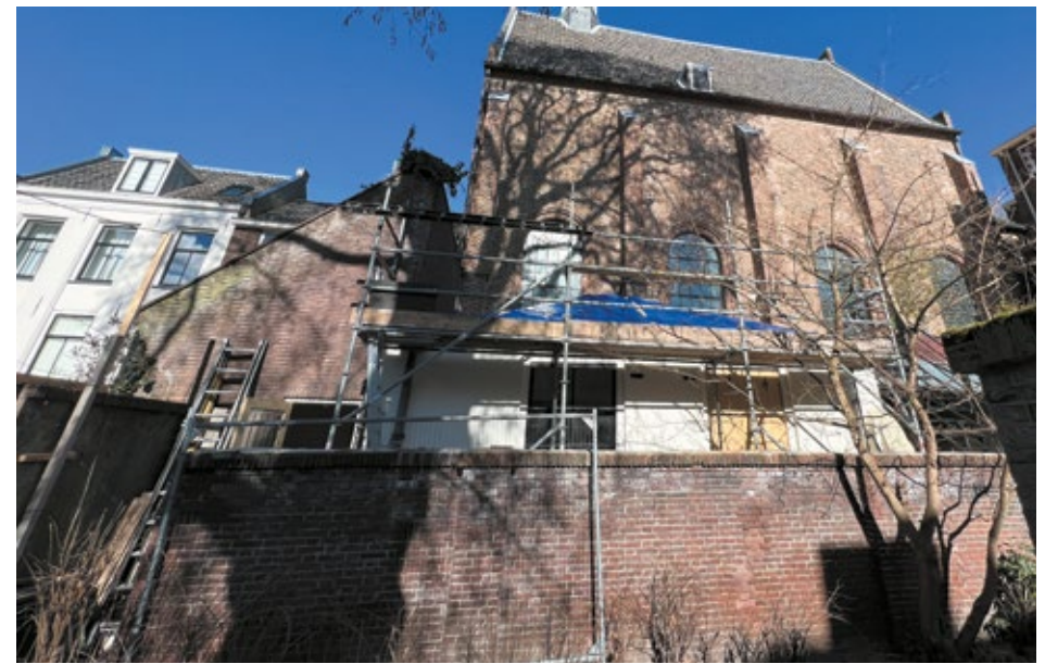
Opening tuinmuur, toegang tot de A. Dolehof