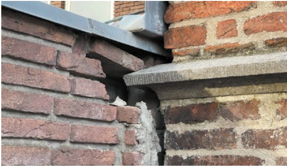
De verzakte tuinmuur